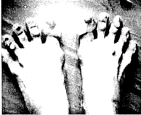
-발레리나 강수진씨의 발