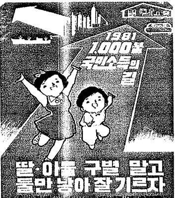
딸, 아들 구별 말고 둘만 낳아 잘 기르자

◀그뎨 그랬지▶ 가족계획 표어 변천사 60년대 “덮어놓고 낳다 보면 거지꼴을 못 면한다” 70년대 “딸, 아들 구별 말고 둘만 낳아 잘 기르자” 80-90년대 “잘 키운 딸 하나, 열 아들 안 부럽다” 2000년대 “아빠, 혼자선 싫어요 엄마, 저도 동생을 갖고 싶어요” 한 집에 한명씩만 더 낳아도 삼천리는 초만원이라고 위협(?)하며 셋째부터는 의료보험 혜택도 주지않던 시절이 있었습니다. 이제 세월이 흘러 출산가정에 출산비도 지급한다는 정책을 보며 인간사의 부침을 봅니다. 할아버지부터 손자까지 한 집에 지내며 가족이 무엇인지를 살면서 배우던 그 시절이 새삼스럽습니다.