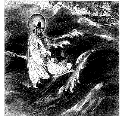
물 위를 걷다

내 죽어 하나님 앞에 설 때 여기 세상에서 한 일이 무엇이나 한 사람 한 사람 붙들고 물으시면 나는 맨 끝줄에 가 설 거야 내 차례가 오면 나는 슬그머니 다시 끝줄로 돌아가 설 거야 아무리 생각해도 나는 세상에서 한 일이 없어! 끝줄로 가 서 있다가 어쩔 수 없이 마지막 내 차례가 오면 나는 울면서 말할 거야 정말 한 일이 아무것도 없습니다 그래도 무엇인가 한 일을 생각해 보라시면 마지못해 울면서 대답할 거야 하나님 길가의 돌 하나 주워 신작로 끝에 옮겨 놓은 것 밖에 한 일이 없습니다.