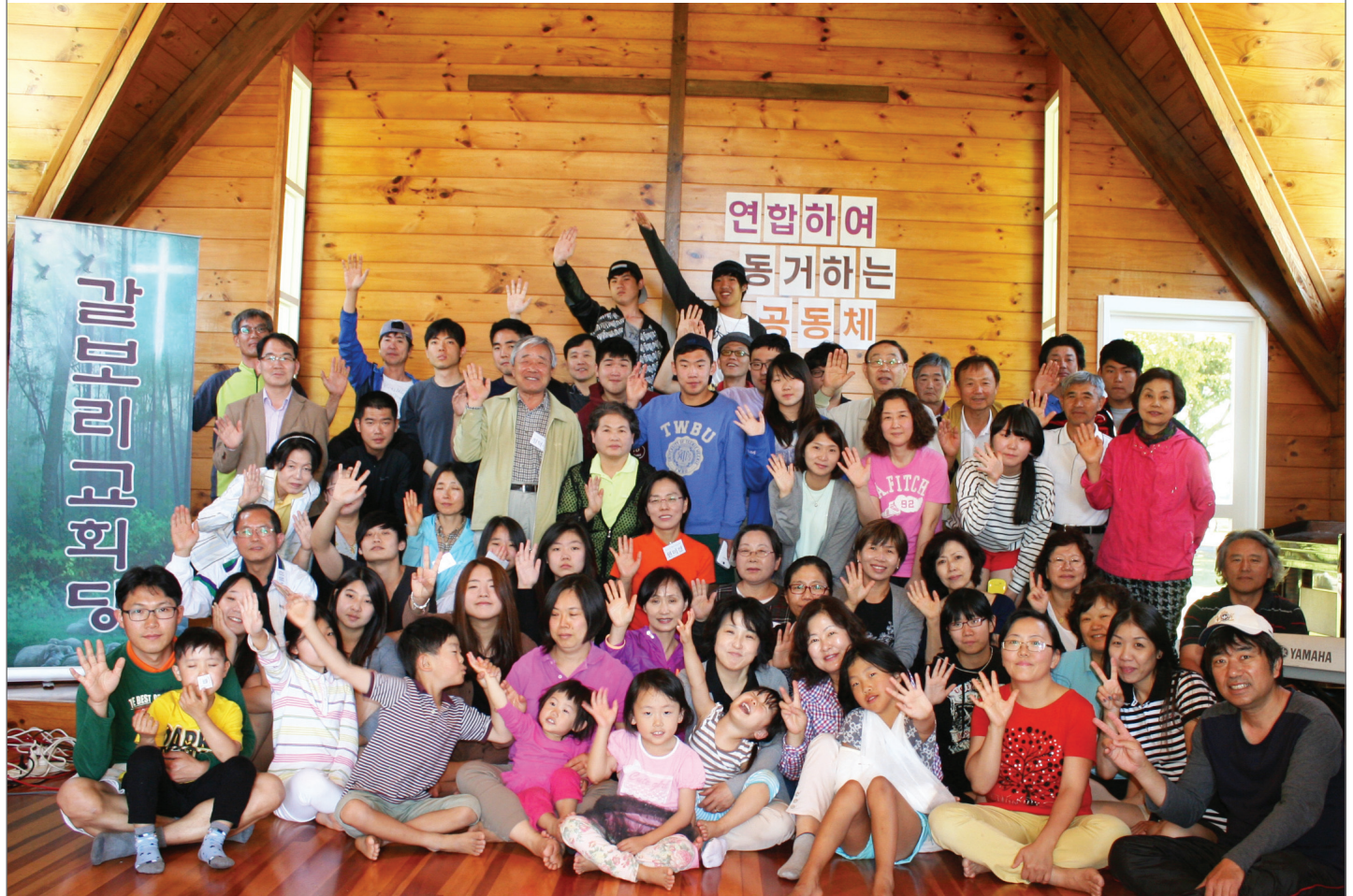
갈보리 수련회 2013년 12월 31일 - 2014년 1월 2일, Hunua Falls 크리스천 캠프

수련회: 12월 31(화)-1월 2일(목) 신년주일: 1월 5일(주일) 제직주일: 1월 19일(주일)