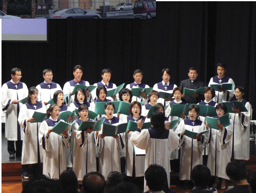
Auckland Girl's Grammar 시절