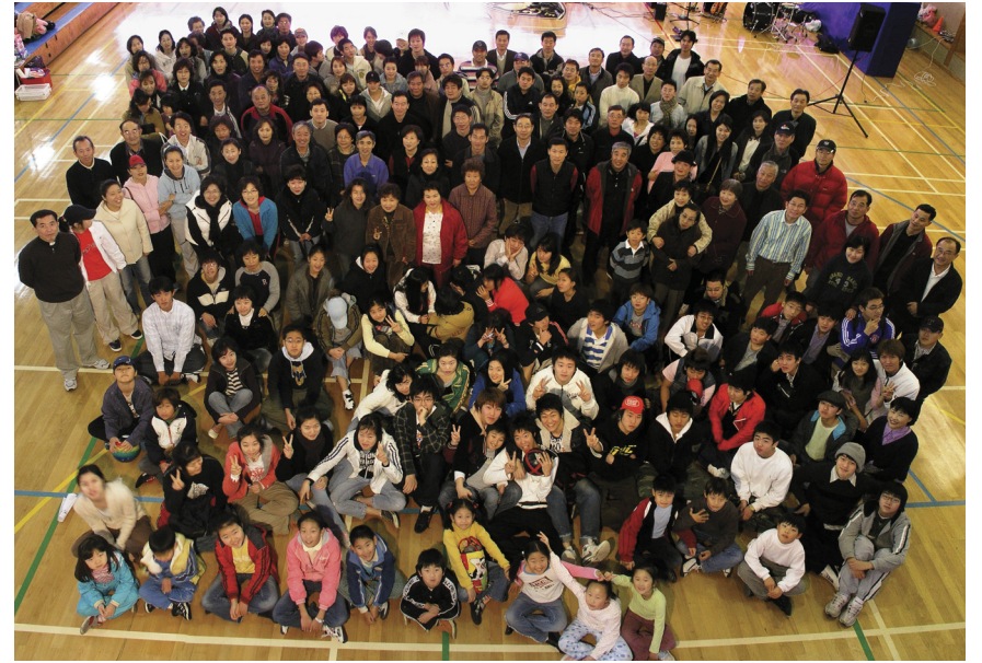
2005년 7월 체육대회