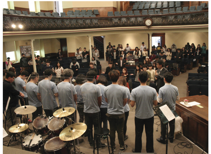
2014년 6월 바누아투 선교팀 환송(대흥교회)