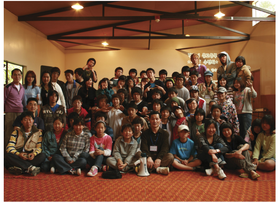
2007년 9월 중고등부 수련회