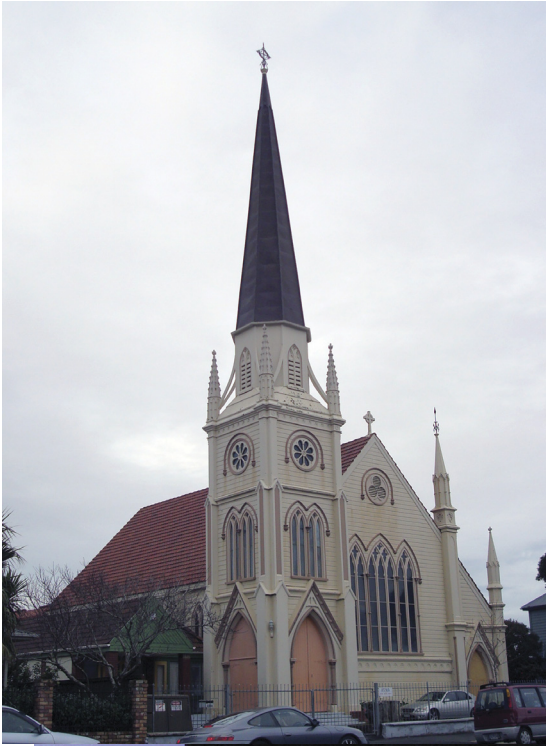
갈보리교회가 15년전 처음 예배를 드렸던 Ponsonby에 있는 Samoan Church