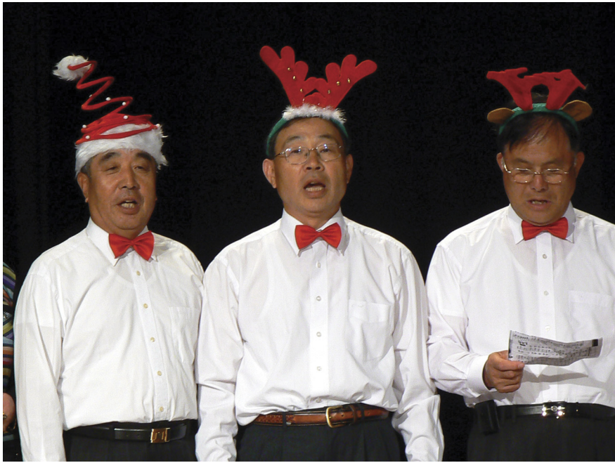
2006년 12월 24일 펌프하우스, 크리스마스전야제