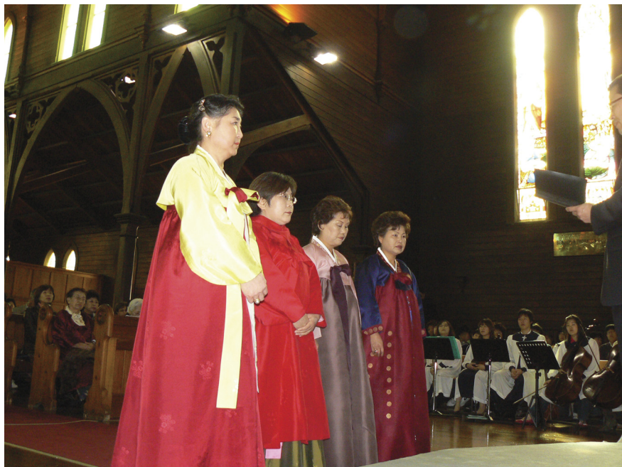
2006년 7월 16일 장로, 안수집사 임직식