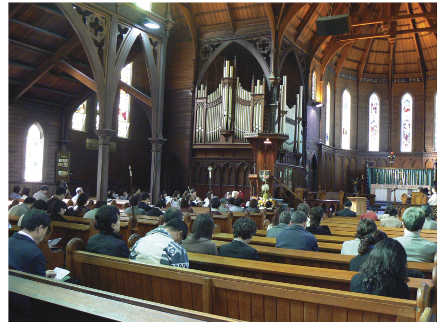
Church of the Holy Sepulchre 시절