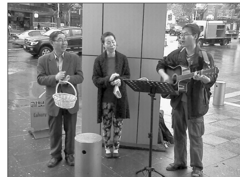
18 일 전도 대회