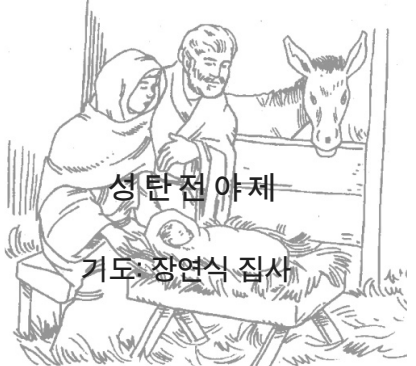
성탄전야제 기도: 장연식 집사