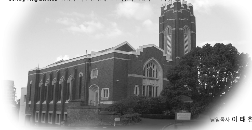
담임목사 이 태 한

Serving Neighborhood 섬김과 나눔을 통해 이민자들의 이웃이 되어주는 교회