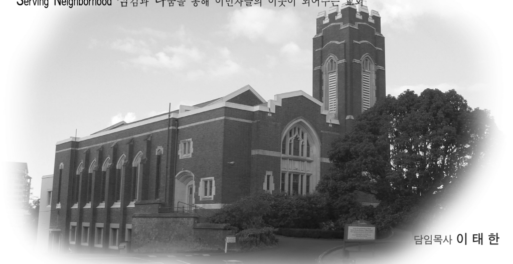
담임목사 이 태 한