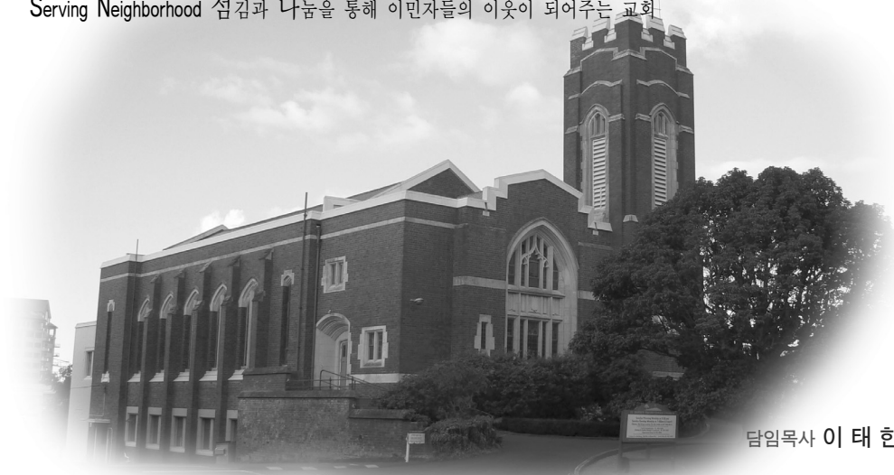
담임목사 이 태 한