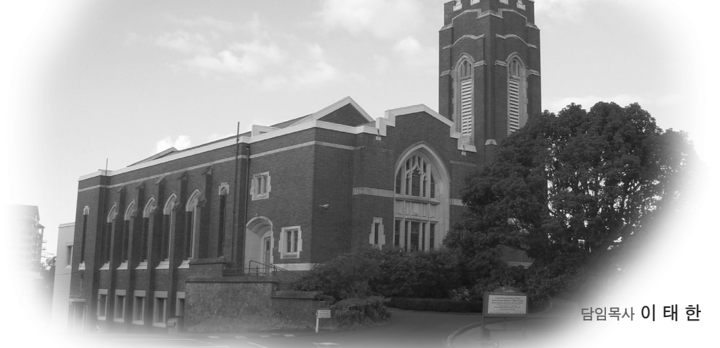
담임목사 이 태 한