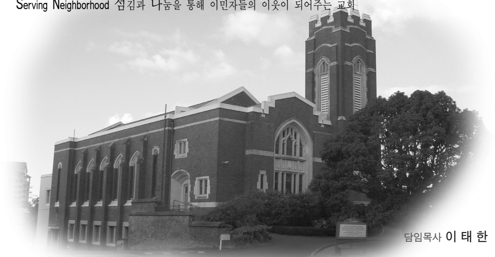
담임목사 이 태 한