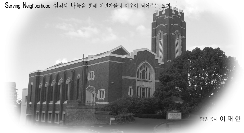
담임목사 이 태 한