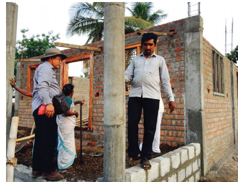
탄두성전 벽돌쌓기 현장입니다.

계속해서 기도해주시기 바라며 현재 사역중인 교회 건축 사진을 몇개 보내드립니다.