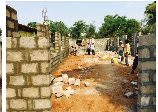
만달라팔히 성전 공사현장