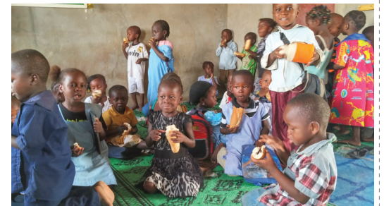
샌드위치 먹는 아이들