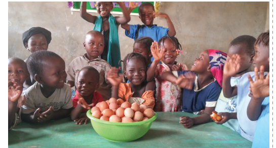
삶은 계란 간식