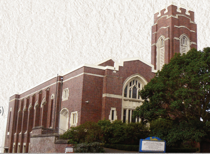
교회창립 1999년 7월 18일