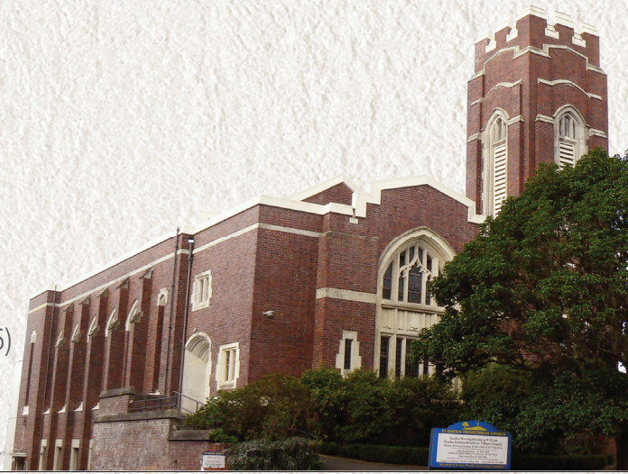
교회창립 1999년 7월 18일