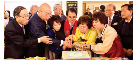
2017년 표어 · '다음세대를 세우는 건강한 교회'(신6:4-9)