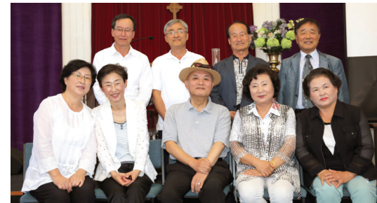
2017년 표어 · '다음세대를 세우는 건강한 교회' (신6:4-9)