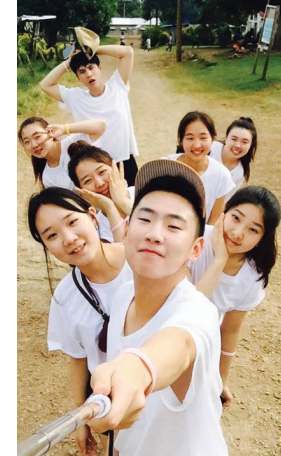
교회창립 1999년 7월 18일