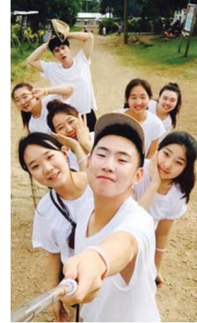
교회창립 1999년 7월 18일