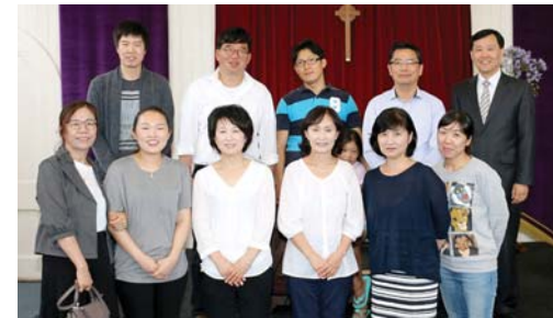
2017년 표어 · '다음세대를 세우는 건강한 교회' (신6:4-9)