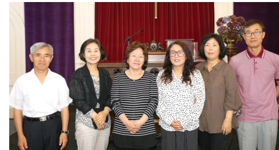
2017년 표어 · '다음세대를 세우는 건강한 교회' (신6:4-9)