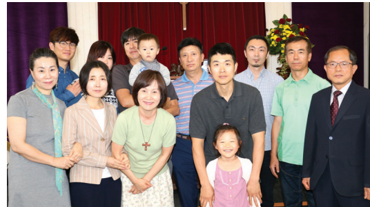
2017년 표어 · '다음세대를 세우는 건강한 교회' (신6:4-9)