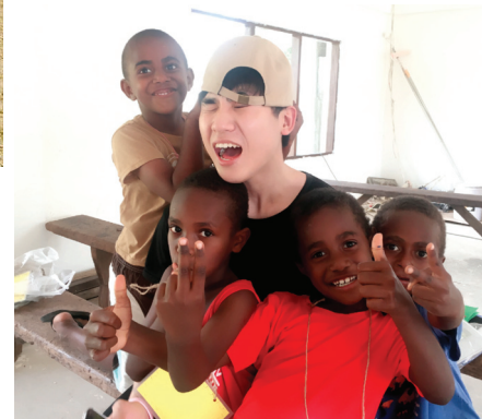
교회창립 1999년 7월 18일