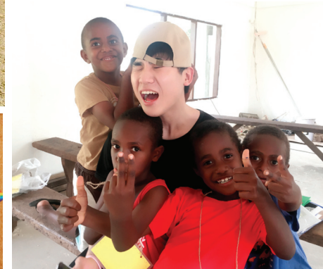
교회창립 1999년 7월 18일