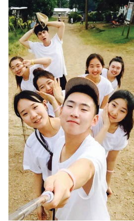
교회창립 1999년 7월 18일