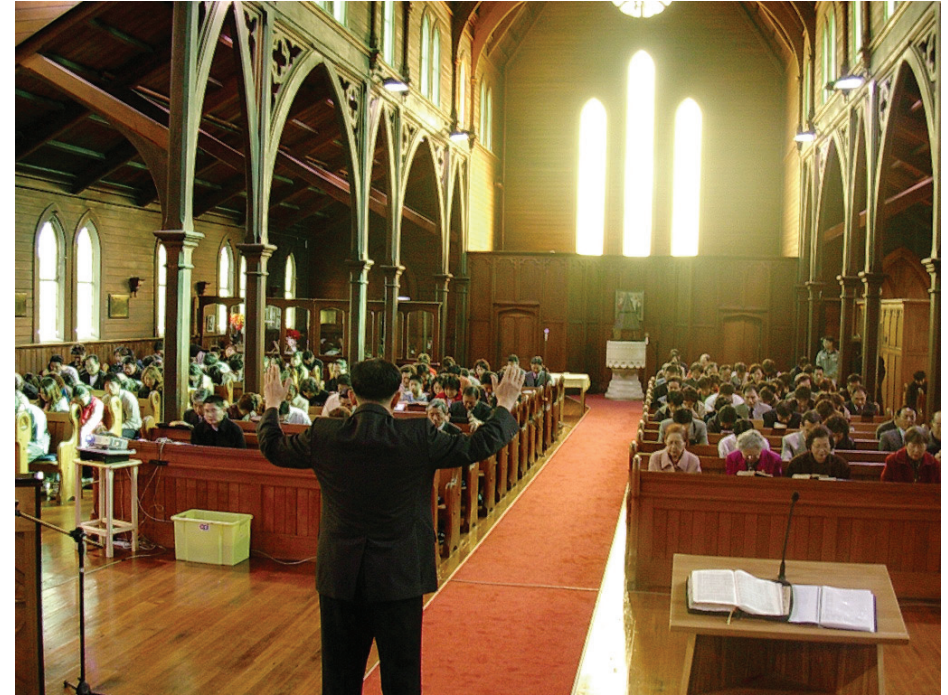
추억의 사진: 2004년 5월 30일 현교회 건너편에 있는 Church of the Holy Sepulchre에서의 예배