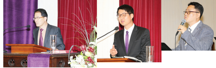
교회창립 1999년 7월 18일