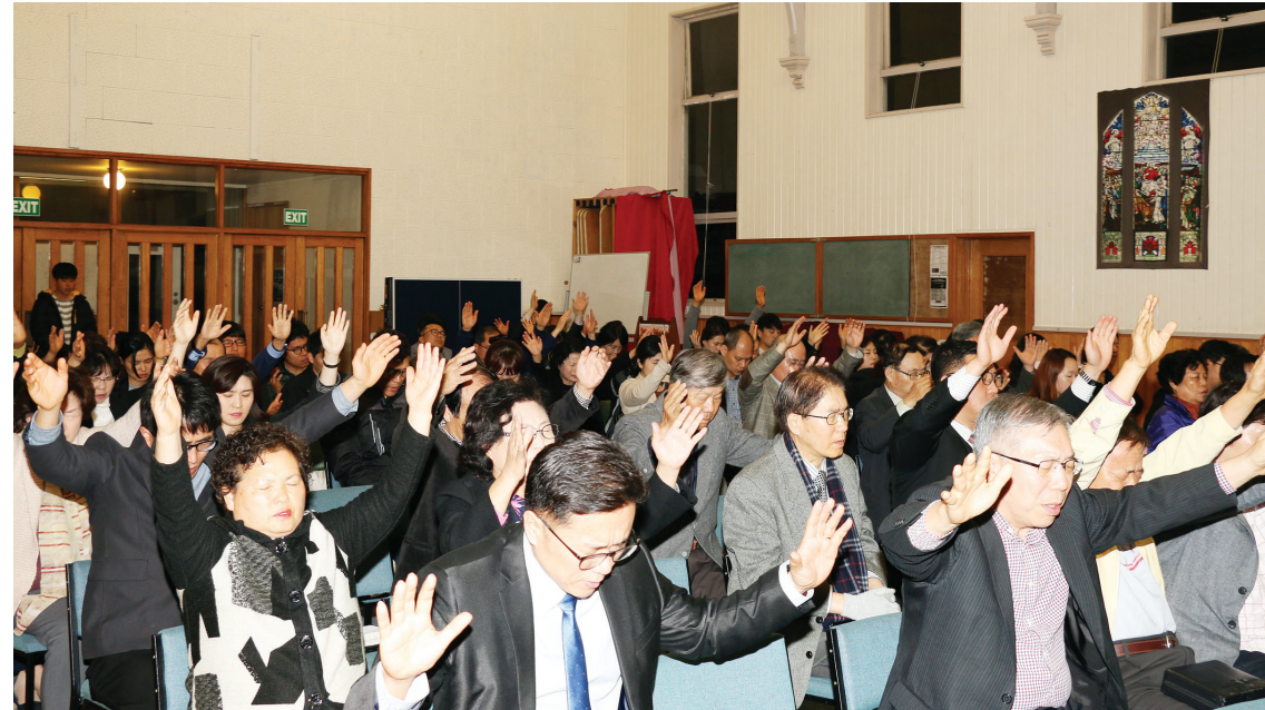
2017년 9월 27일 노회연합수요예배