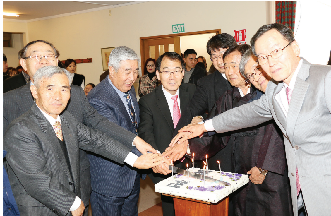
2017년 7월 16일 18주년 감사예배