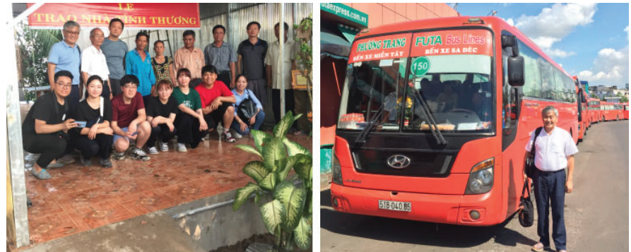
남부지방의 목회자들과 달랏에서 세미나를 마치고