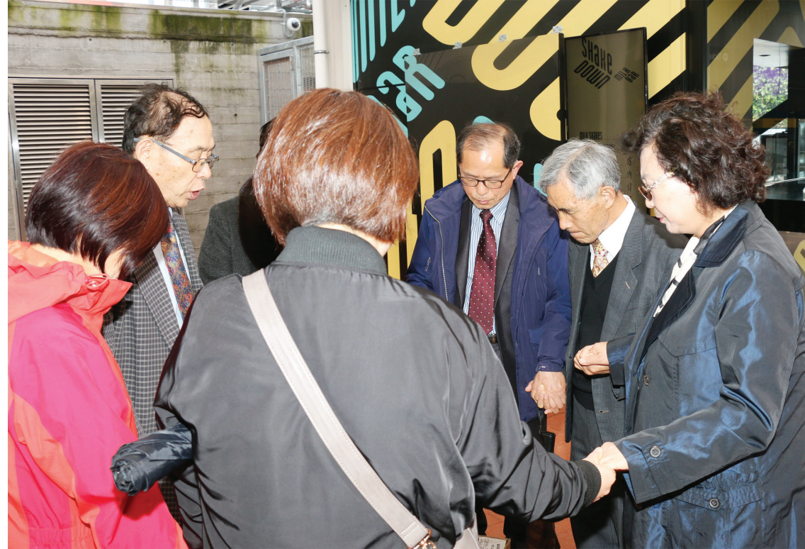
2017년 10월 8일 시내전도