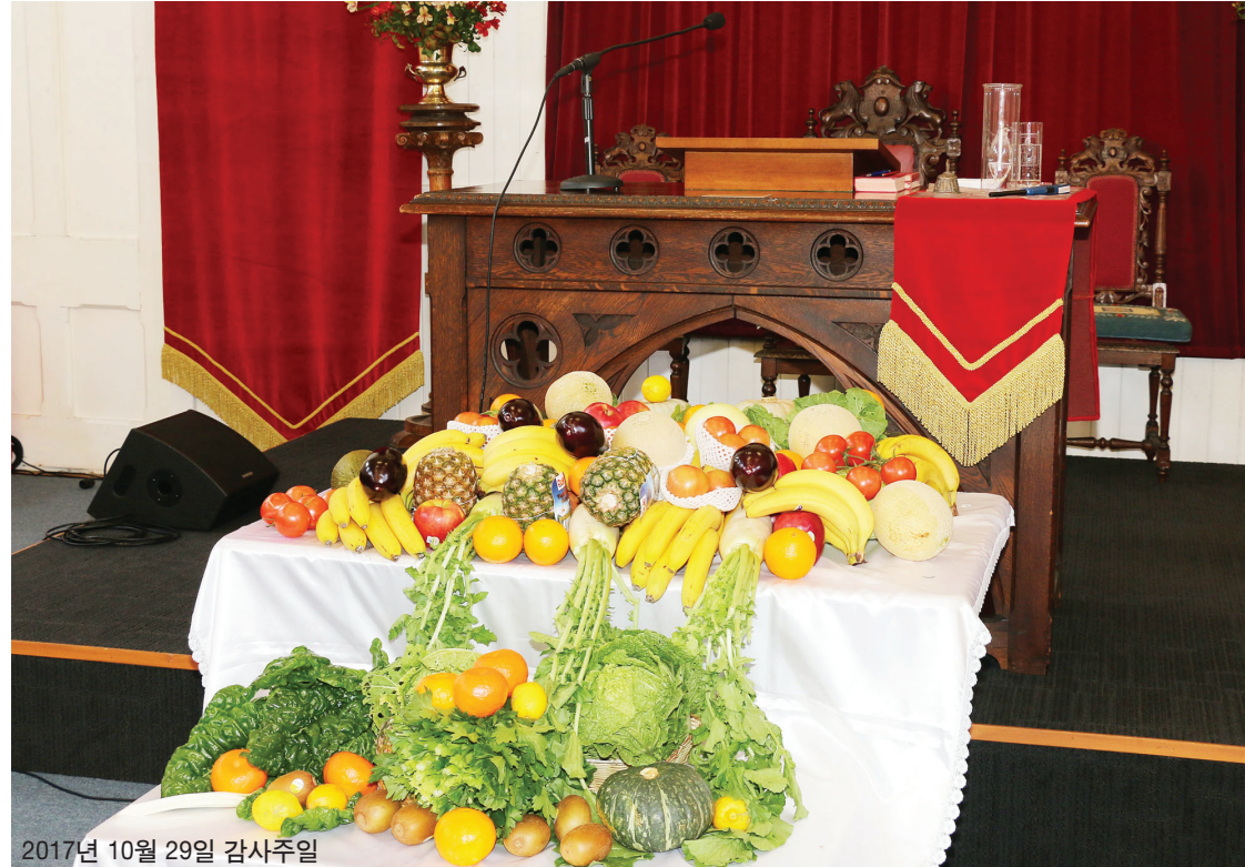
2017년 10월 29일 감사주일