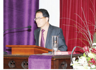
교회창립 1999년 7월 18일

www.youtube.com/calvaryorgnz www.koreaniptv.co.nz