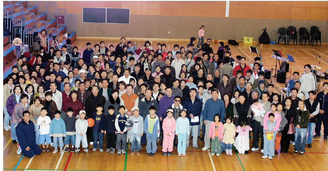
추억의 사진: 2004년 7월 11일 체육대회 후 단체사진