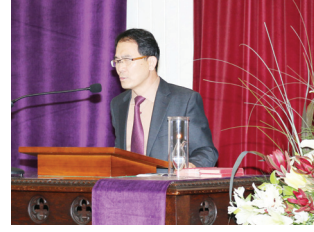
교회창립 1999년 7월 18일

www.youtube.com/calvaryorgnz www.koreaniptv.co.nz