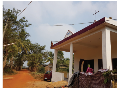
벤카타푸람 성전. 연말에 완공