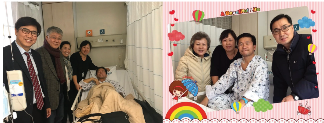
수술 직후 문병 온 동역자들과 함께