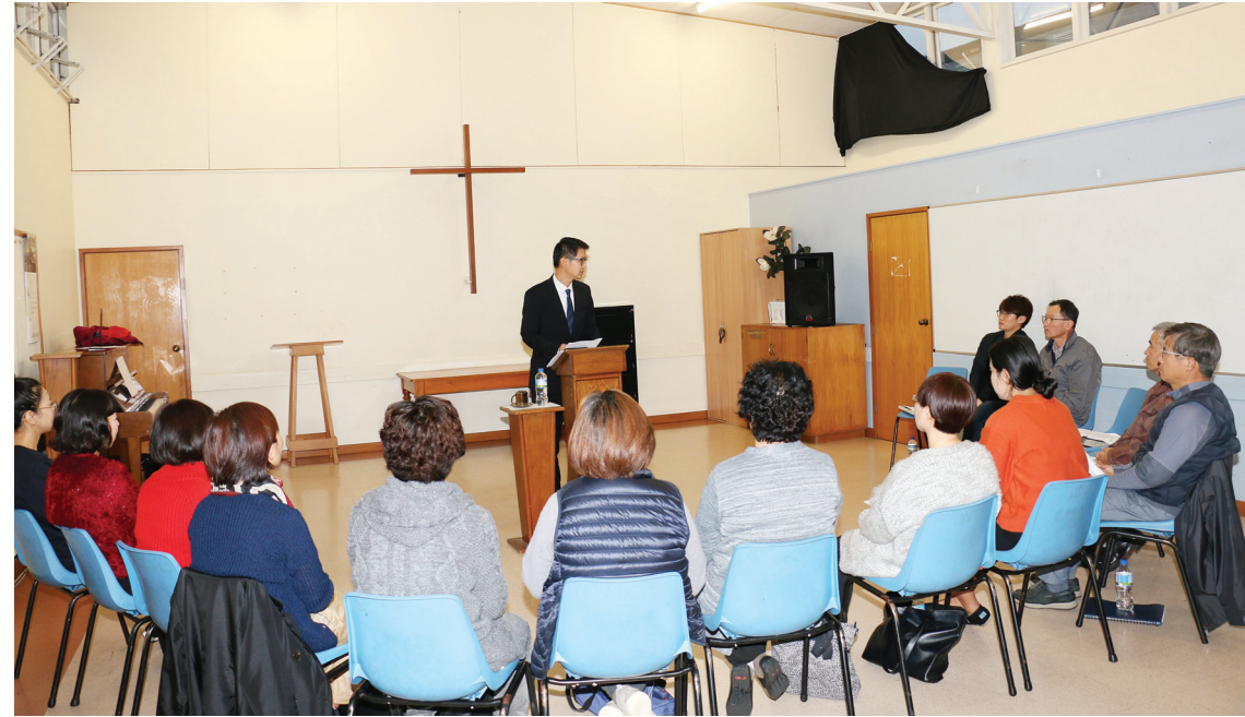
나무십자가 찬양대 세미나