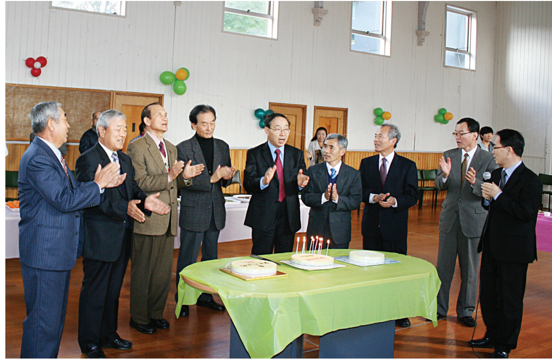
2011년 창립 12주년