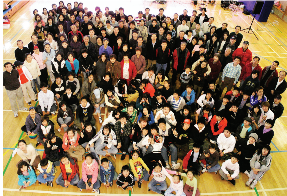
2005년 7월 18일 창립 6주년 기념 체육대회