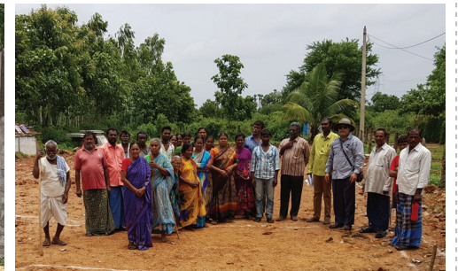
무타라시팔 성전 기초공사