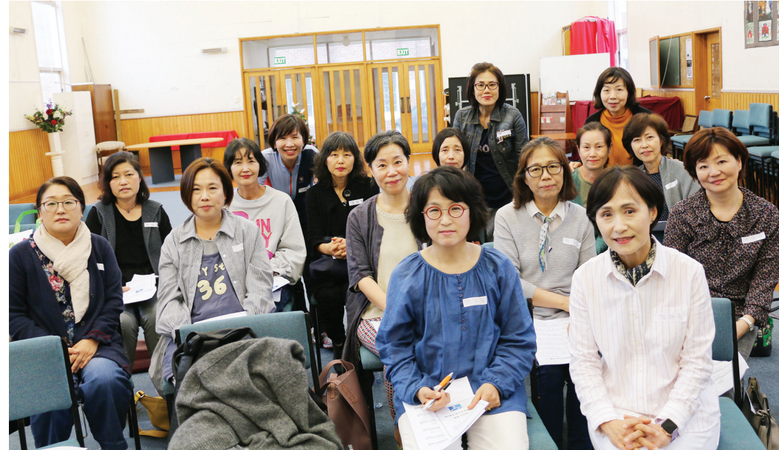
2,3여선교회 연합 일일수련회, 2018년 12월 1일