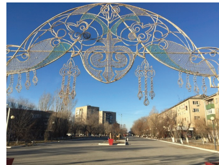
전통문양으로 길거리를 장식한 전구

학원 학원도 연말 준비로 바쁩니다. 영어 레벨에 따라 몇 개 반을 하나씩 만들어 특별 수업을 하기 위해 준비하고 있습니다. 어떤 내용과 게임을 할 것인지 선생님들이 아이디어를 내고 계속 만나고 있습니다. 그리고 각 교실에 크리스마스 장식을 곧 하게 됩니다. 특별 수업이 재미있고 유익해서 학생들이 재미있어 하고, 학부모들에게는 좋은 평가가 되어 학원이 잘 홍보 되었으면 좋겠습니다.